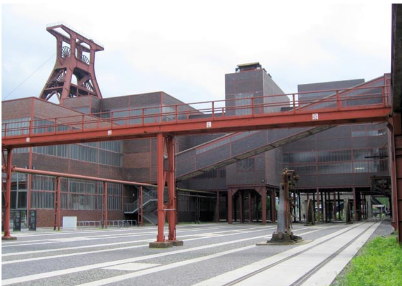
Halle 18.1-5 und 19; Denkmalpfad Zollverein

Die Geschichte der Zeche Zollverein in Essen begann im Jahre 1851, als die erste Tonne Kohle über Schacht 1 gefördert wurde. 135 Jahre später, am 23.12.1986 wurde die Zeche Zollverein stillgelegt. Damit endete der Bergbau in der Stadt Essen. Nach der ursprünglichen Nutzungsphase wurde die Zeche nach und nach in ein kulturelles Kleinod des Ruhrgebiets verwandelt, das jährlich von vielen tausend Menschen besucht wird. Die außergewöhnliche Beschaffenheit des Areals stellte besondere Herausforderungen an die Elektroinstallationen und Sicherheitseinrichtungen.