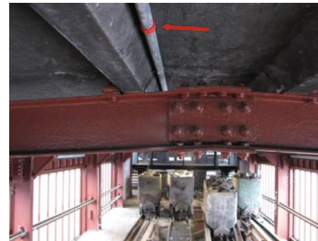
verdeckte Anordnung von Ansaugrauchmeldesystemen

kann die Sicherheitstechnik unsichtbar zum Schutz der Besucher betrieben werden.